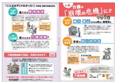
京橋宣伝配布ビラ